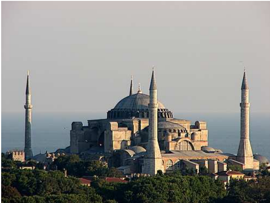
Hagia Sophia, Istanbul,

DAS JÜDISCHE JAHR 5771-5772 DAS MUSLIMISCHE JAHR 1432-1433